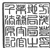
座 標 求 積 表